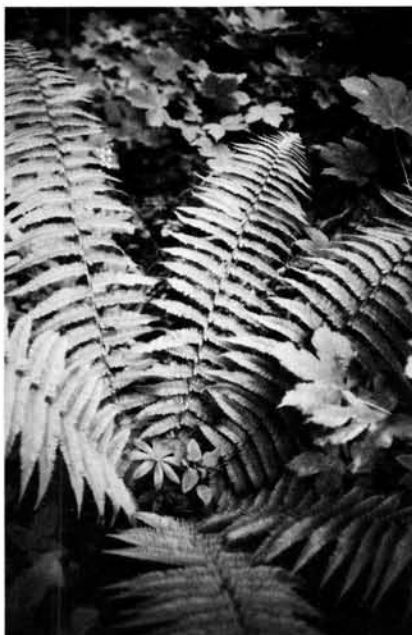
Figuur 2. Dryopteris pseudomas . Habitus.

Bij Epen is zij ook eerder in 1929 waargenomen (steriel materiaal in herbarium Natuurhistorisch Museum Maastricht). In het Elzetterbos werd Dryopteris pseudomas in 1986 teruggevonden onder Alnus en Fraxinus op een zandig-