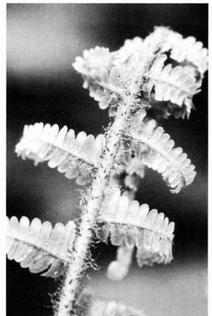
Figuur 4. Dryopteris pseudomas . Uitlopend blad. Let op de afgeknotte bladsegmenten en de priemvormige schubben.