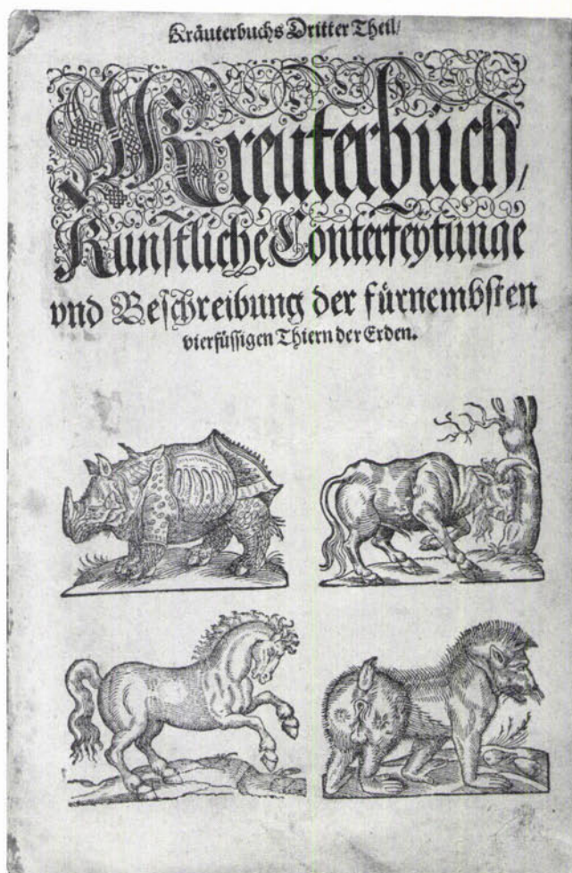
Figuur 1. Titelpagina van het derde deel.