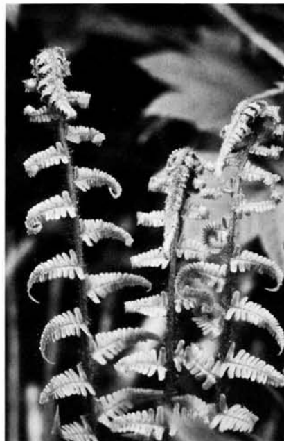
Figuur 3. Dryopteris pseudomas . Uitlopend blad.