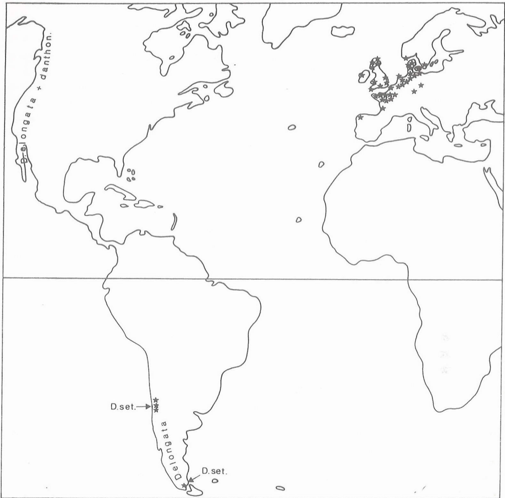
Figuur 1: Areaalkaart van Deschampsia setacea (met asterisken aangegeven). Ook het verspreidingsgebied van de nauw verwante Deschampsia elongata en Deschampsia danthonioides is globaal aangeduid (naar Parodi, 1949 en Hultén, 1968).

sen aangetroffen. Sindsdien is zij op nog eens vier groeiplaatsen (her)ontdekt. Negen van de tien plekken zijn door ons in de jaren 1989-1991 bezocht; op één ervan was de plant niet terug te vinden, op acht hebben we vegetatie-opnamen gemaakt. Van de tiende lokatie stelde O. Zijlstra