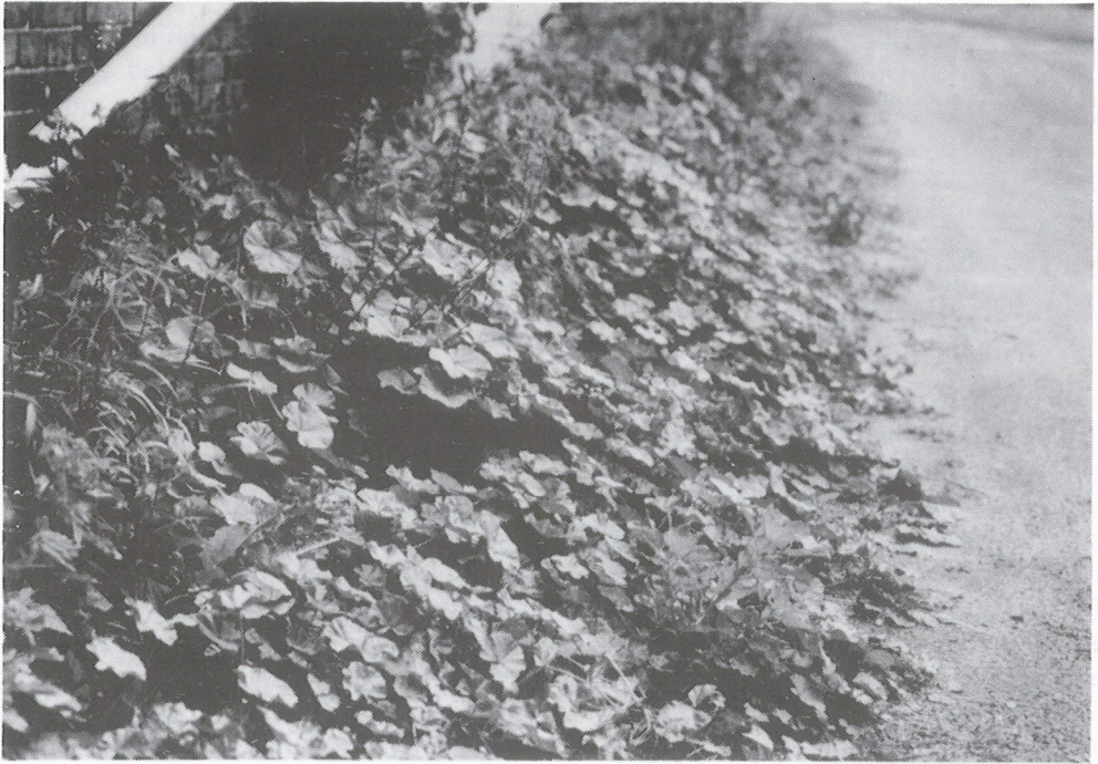
Malva neglecta .

cutabele syntaxa verdient mogelijk ook het Malvetum neglectae (of daarvan afgeleide namen zoals het Urtico urentis-Malvetum neglectae ) een plaats, en daarover handelt dit artikel: bezinning is een goede zaak, ook binnen de plantensociologie.