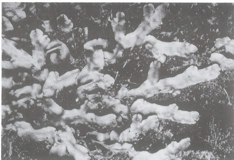
Kegelmos op baksteen-beschoeiing aan de Tweekelerbeek bij Boekelo.

woordt door de bedekkingscijfers van Conocephalum conicum (4) en Pellia epiphylla (2) beter aan het 'ideaalbeeld' van de associatie dan de drie Twentse opnamen in Maas' tabel 9, terwijl de grootte van het proefvlak geringer en daardoor adequater is dan bij sommige andere opnamen van dezelfde auteur. De opgave van Glyceria plicata (= G. notata subsp. notata ) in de opname is twijfelachtig; vermoedelijk gaat het om Glyceria fluitans .