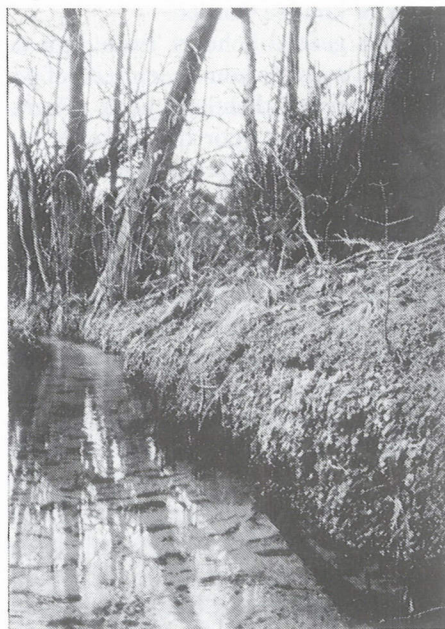
Het Pellio-Conocephaletum aan de Hegebeek bij Buurse.

Barkman (1961) stelt dat de soort zich in de 20ste eeuw in Nederland uitgebreid heeft: voor 1900 was Kegelmos volgens zijn gegevens van 10 vindplaatsen in Zuid-Limburg en 4 daarbuiten bekend, na 1900 van vele plaatsen in Zuid-Limburg en 17 daarbuiten, onder meer in de Achterhoek en Noord-Brabant (vergelijk ook Booy & Groenhuijzen 1959). Aangezien de voornaamste concentraties van vindplaatsen in het laagland zich bevinden in Twente en Noord-Brabant, gebieden die in de vorige eeuw niet bijster veel aandacht van bryologen hebben gekregen, lijkt het zeer wel