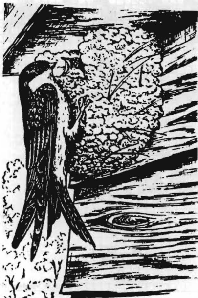
Huiszwaluw (Sjef Kerkhofs).

Overigens wijzen de eerste resultaten van 1990 er op dat dit jaar een in vergelijkbaar met 1989 tamelijk mager jaar is, net als bij de Oeverzwaluw. Dit moge een aansporing zijn tot deelname aan dit onderzoek!