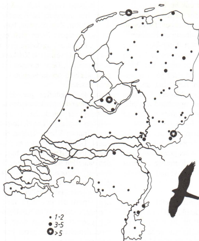
Figuur 3. Aantal Blauwe Kiekendieven per route, februari 1991.

plaren lieten zich op twee routes verschalken. Dat geeft te denken. Menige IJsvogel zal zijn leven stijf bevroren geëindigd zijn.