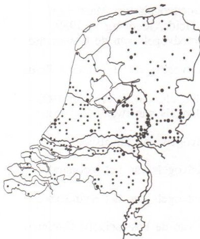
Figuur 1. PTT-routes februari 1991. Kleine stip: 1 route, grote stip: 2 of meer.

Op in totaal 265 routes werden tellingen uitgevoerd (figuur 1), hetgeen iets minder dan vorig jaar is. De minder gunstige telomstandigheden zullen hierbij een handje hebben meegewerkt. Vooral de vroege starters werden weer eens gestraft voor