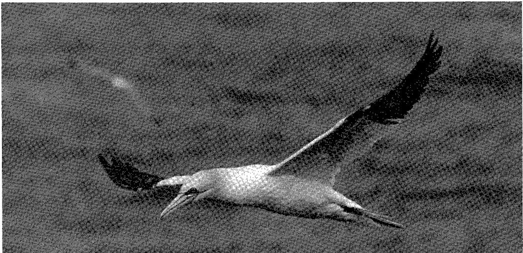
Jan van Gent, Noordzee. Gannet Sula bassana.