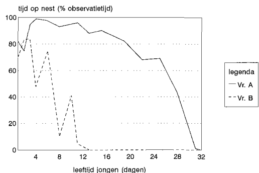
Figuur 1. Doorgebrachte tijd van beide vrouwtjes op het nest, uitgedrukt als percentage van de observatietijd, in relatie tot de leeftijd van de jongen. Time both females spent at the nest in relation to the age of the young, expressed as percentage of observation time.

Vanaf 25 juni (jongen zes dagen) zat vrouw B niet meer op de jongen in aanwezigheid van vrouw A. Op 20 en 21 juni kon nog een gelijke aanspraak op het verzorgen van de jongen en eieren worden geconstateerd, maar op 22 en 23 juni leek vrouw A deze zorg nadrukkelijk voor zich op te eisen. Na verorbering van een prooi bijvoorbeeld, ging vrouw A op de eieren en jongen zitten, waarna vrouw B half op vrouw A ging zitten. Bij de verzor-