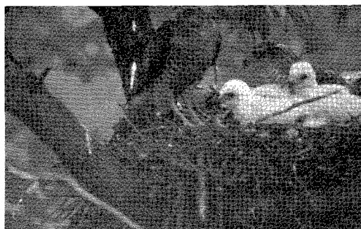
Beide sperwervrouwtjes op het nest, Haren, juni 1991. 1: vrouw A diep in nestkom, vrouw B (links) er half naast, 2: vrouw B voedert vrouw A (kleine jongen in nest), 3: vrouw B (links) heeft prooi gebracht, vrouw A staat achter de jongen. Brood-sharing in Sparrowhawk, Haren, June 1991. 1: female Sparrowhawk A brooding, female B (left) ditto, 2: female B feeds female A (early hatchling stage), 3: female B with prey (left) on nest with female A and half-grown nestlings.

Op 26 juli werd de schuilhut uit het nestbos verwijderd. Twee jongen en vrouw A vlogen in en boven het bos rond. In het hierop volgende jaar (1992) was dit sperwerterritorium eveneens bewoond, maar nu op de gebruikelijke wijze, met één vrouwtje en één mannetje, die vier jongen grootbrachten.