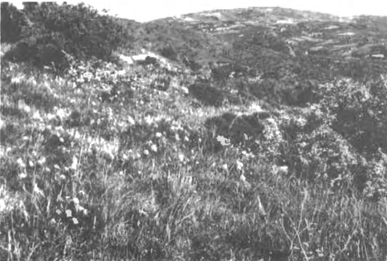
Open phrygana met grazige plaatsen en Orchis Italica , Agia Varvara, 3-4-1989