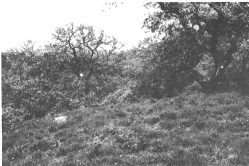
Eikenstruweel, maquis en olijfbomen, biotoop van o.a. Ophrys candida , Kissl Kambos 16-4-1989