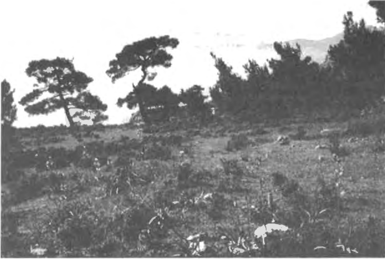
Kortgrazige vegetatie met Affodiel en o.a. Barlia robertiana en Ophrys fleischmanii , Anatoli, 1-4-1989