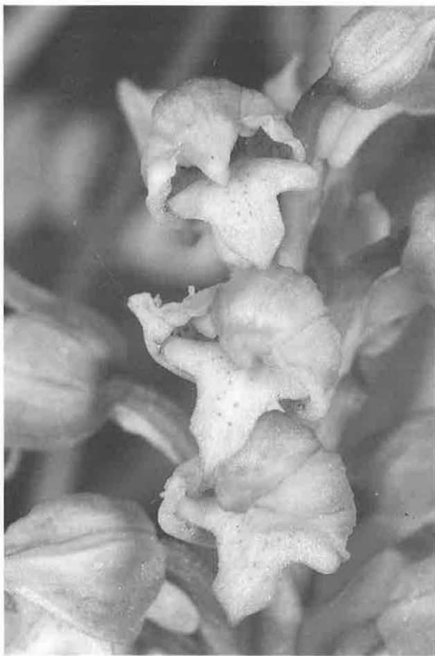
Afb. 5: Orchis simia × Platanthera bifolia ?, Lavaux-Sainte-Anne, 23-05-1992