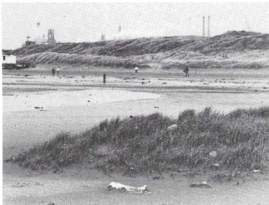
Primaire duinen op de strandvlakte bij IJmuiden met op de achtergrond de Hoogovens.

Nu krijgen we vrijwel voor niets een zich 'spontaan' vormend duingebied terug. De Stichting Duinbehoud bepleit daarom een zo volledig mogelijke natuurlijke ontwikkeling van de strandvlakte. Daarbinnen moet ruime aandacht zijn voor natuurgerichte recreatie. Veel mensen zullen zich aangetrokken voelen tot de dynamiek van het landschap, de variatie in ruimte en tijd en de rust in het gebied. Door een gerichte ontsluiting zal men de mensen hier ook van kunnen laten genieten. Het belang van het gebied voor het observeren van vogels zal aanzienlijk toenemen. In het kader van het Nationaal Park tussen IJmuiden en Zandvoort zou een bescheiden bezoekerscentrum of