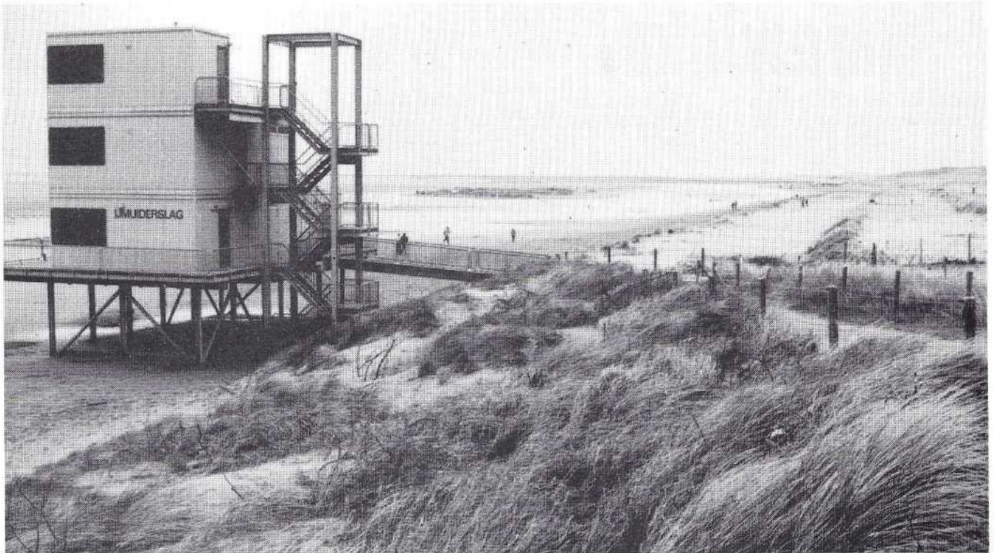
Eerste recreatieve ontwikkeling op het strand bij de IJmuiderlag.

tentoonstellingsruimte kunnen worden ingericht, die vooral deze aspecten belicht.