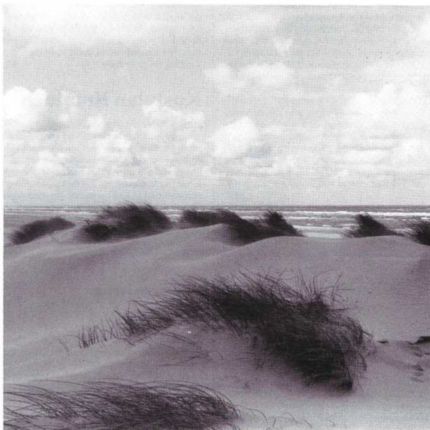
Stuivende duinen langs de kust passen binnen een dynamisch beheer van de zeereep.

DEN HAAG/UTRECHT - Zowel de Raad voor advies van de Ruimtelijke ordening (RaRo) als de Natuurbeschermingsraad kiezen, als reactie op de nota "Kustverdediging na 1990" van het Ministerie van Verkeer en Waterstaat, voor het handhaven van de huidige kustlijn. Maar dan wel op een dynamische