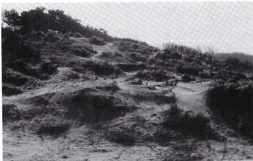
Een stukgelopen deel van de Waalsdorpervlakte met veel onofficiële paden (foto: Kees Wijgh).

In de vallei en de Vlakte van Waalsdorp komen jaarlijks vele duizenden honden. Alleen al in de vallei laten die zo'n 10.000 kilo hondenpoep achter. Deze mest draagt bij aan de uitbundige groei van voedselminnende planten, zoals brandnetels. Tevens verstoren loslopende honden andere dieren en vernielen ze de vegetatie. Daarnaast hebben ook recreanten last van honden. Het is immers niet prettig om de hele tijd naar de grond te moeten kijken om de hondenpoep te ontwijken. Loslopende honden zorgen tevens voor gevaarlijke verkeerssituaties als z.b.v. fietsers in de wielen lopen.