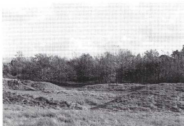
Rechts onder: Begreppelde Vroongraslanden omzoomd door een houtwal bij Renesse.