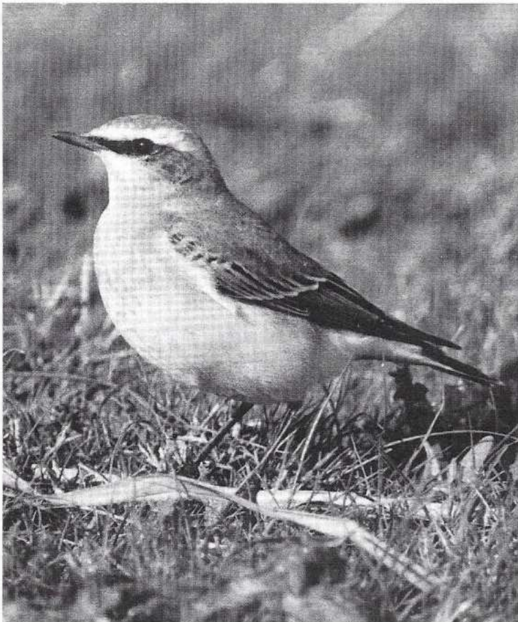
De Tapuit broedt in konijnholen op de Vroongronden.