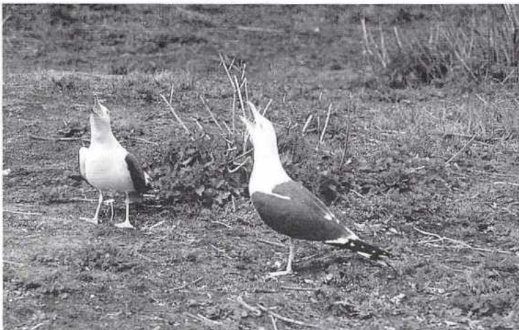
"Luid jubelend hebben ze ons plekje in het dal ingenomen." (foto H. Wanders).

juichkreten tijdens de baltsvluchten boven onze woonplaatsen. De duinen gaven ons weer alles wat we wensten. Ja, het gebeurde zelfs dat vele mensen op gezette tijden in grote getale naar ons kwamen kijken en daar veel plezier aan beleefden. We vlogen dan wel met de schrik in 't hart strijdlustig boven hun hoofden, vooral als ze een van onze jongen in hun handen namen, want je weet het maar nooit bij de mensen. Maar achteraf gezien viel het geweldig mee en vonden we na hun vertrek alles weer terug zoals het was voor hun komst.