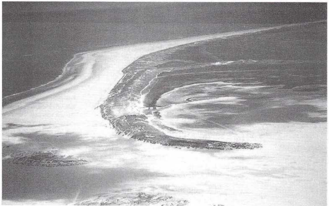
De strandvlakte van de Noordvaarder is een zeer dynamisch landschap. Na het verdwijnen van de militairen ligt hier een unieke kans om een natuurstrand te realiseren.

In 1850 was de huidige Noordvaarder nog een losse zandbank, die door een slenk gescheiden was van het eiland. Geleidelijk verheelde de zandplaat met het eiland, mede dankzij enige hulp van de mens. In 1920 en 1929 werden door middel van meerdere stuifdijkjes delen van de Noordvaarder "ingepolderd" en ontstonden de Kroonpolders. Ofschoon de Noordvaarder al in 1924 werd aangewezen als staatsnatuurmonument, is de naam Noordvaarder toch vooral verbonden aan de activiteiten van het ministerie van Defensie. Na de Tweede Wereldoorlog zocht men grote terreinen voor het oefenen met vliegtuigen en vond deze op Vlieland (Vliehors) en op de Noordvaarder. De aanwezigheid van een schietterrein op de Noordvaarder geeft veel overlast voor de bezoekers van Terschelling en niet in de laatste plaats