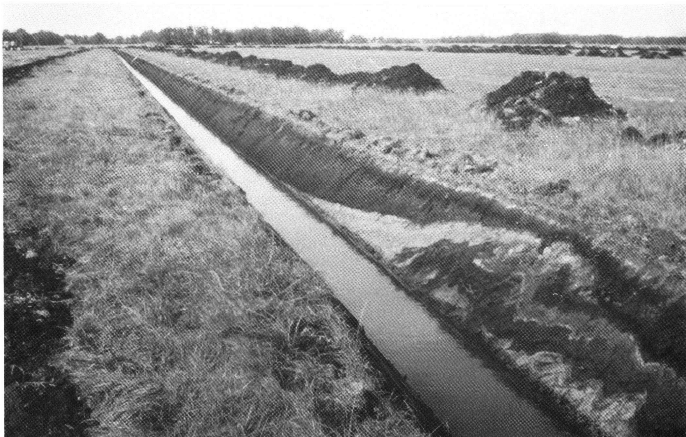
fig. 1 De zanduitstulping tot aan de top van de beide gyttjalagen heeft vooral naar de dalrand toe een sterke plooiing van de gehele sequentie tot gevolg gehad. Dit is te zien op de voorgrond rechts.

Bij het profiel opnemen langs één der sloten werd met de schep gestoten op de eerste ledemaat beenderen van een fossiel hert, waarbij op grond van de eerste vondst gedacht wordt aan het edelhert (dr. Clason, pers.med.). Bij het systematisch afzoeken van