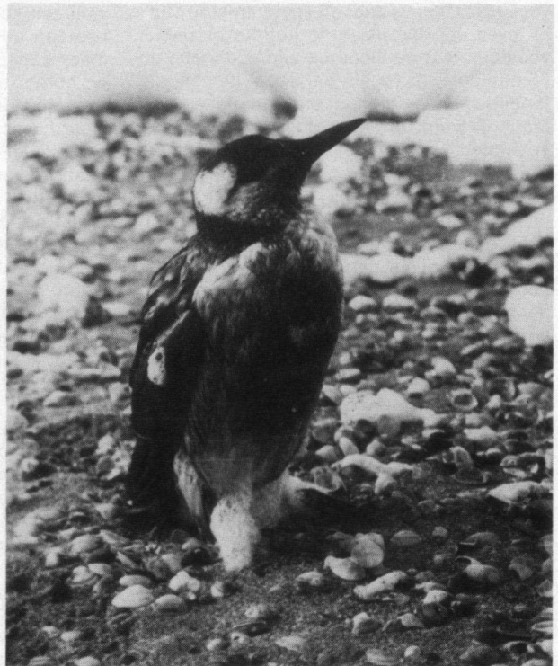
De eerste Zeekoet die ik ooit zag zal ik nooit vergeten.

Vogelbeschermers hoeven dus niet langer met een scheef oog naar de vogelasielen te kijken, zo van 'het is eigenlijk een restant van een onwetenschappelijke, sentimentele aan-