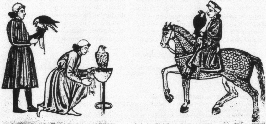
Tafereel uit de Middeleeuwen, de tijd dat de valkerij druk beoefend werd.

In de Baronie waren vanouds veel valkeniers gevestigd. Deze hielden zich op de uitgestrekte heidevelden van dit gebied bezig met de valkenvangst. In vrijwel elk dorp had de Heer van Bre-