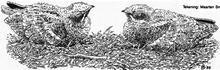
Tekening: Maarten Smit.