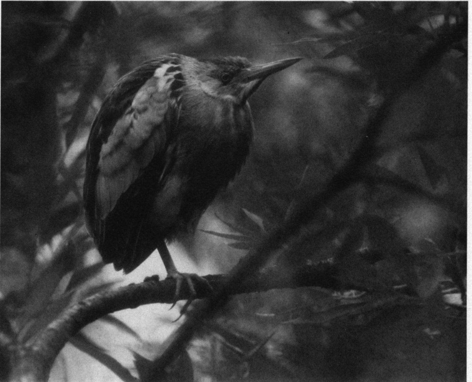
Woudeapje, subadult mannetje, Biesbosch, juni 1990.