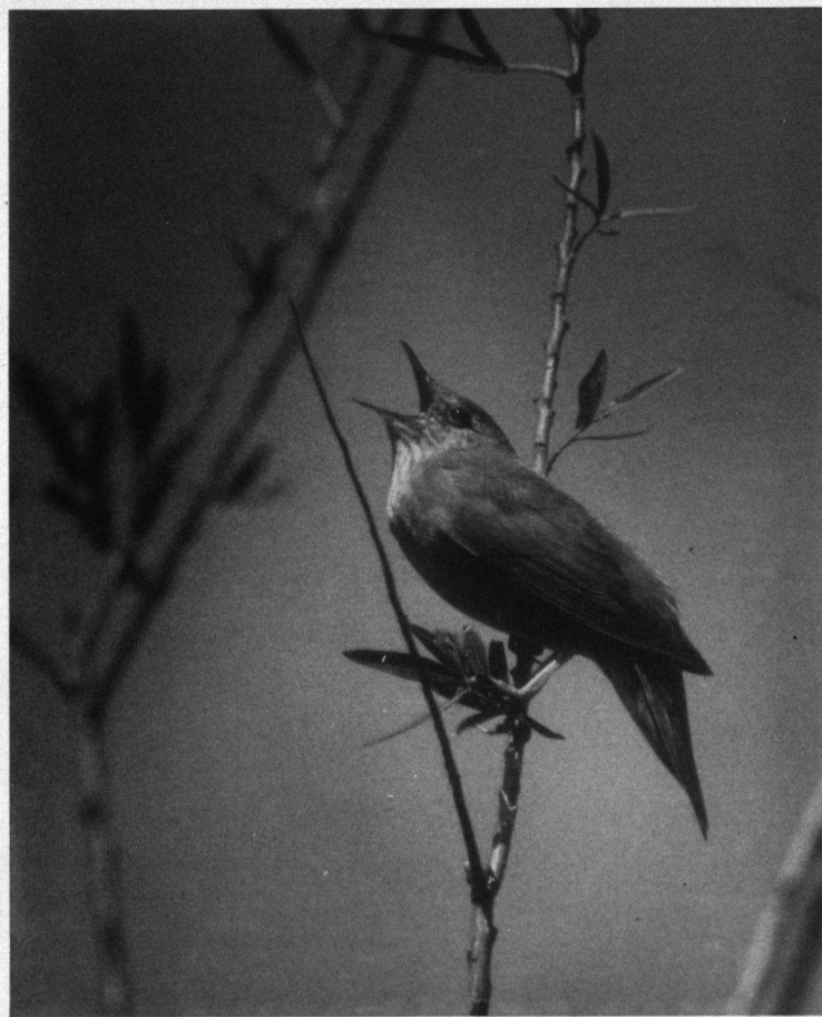
Derde prijs. Zingende Krukelzanger, Blebosch, mei 1990.