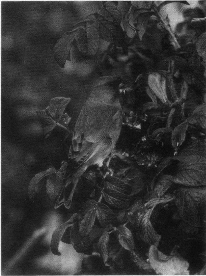
KODAK-Ekterprijs. Groenling, foeragerend op bottels van de Rimpelroos, Texel, oktober 1990. Nikon F3, Nikkor ED 5,6 600 mm. Film: Ekta 125. Naar een kleurenfoto van René van Rossum.