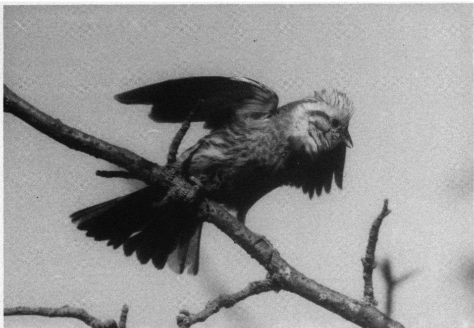
Tweede prijs. Geelgors mannetje in dreighouding, Zweden, 24 mei 1990. Leica R4, Telyt 560.