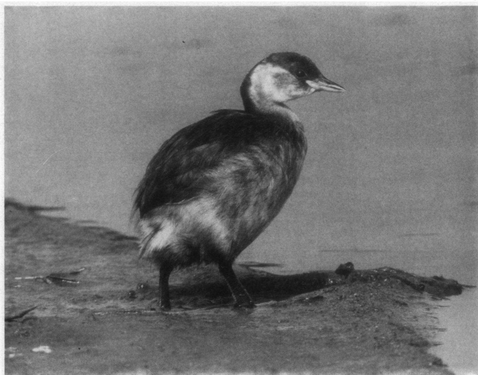
Tweede aanmoedigingsprijs. Dodaars, Oosterland, Zeeland, 2 september 1984. Nikon FE 600 mm teleconverter.