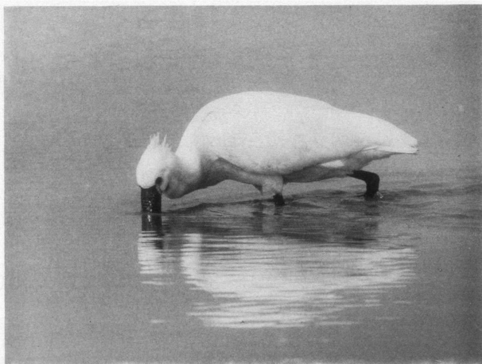
Eerste aanmoedigingsprijs. Vissende Lepelaar, Knardijk, Flevoland, mei 1990. Pentax MX, Novoflex 600 mm.