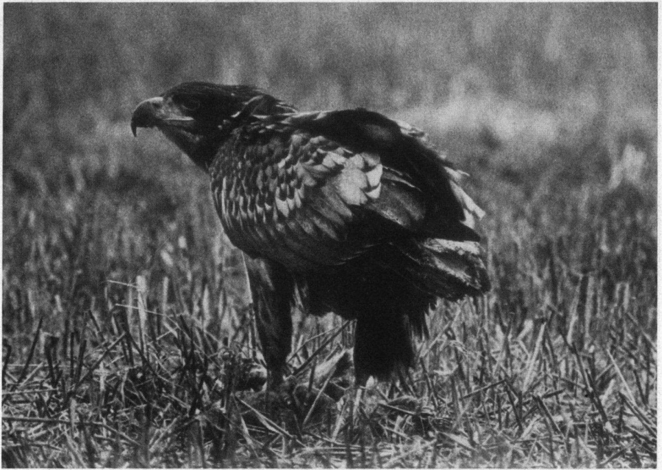
Zesde plaats. Zearend, juveniel, Wieringermeer, 29 januari 1990. Pentax LX, Novoflex 600 mm. Schuifhutfoto.