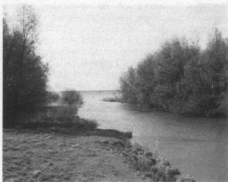
De monding van de Schuringe Haven vormt de scheiding tussen de 'klassieke' eendekooi links en de zogenaamde 'buitentepijp' die vanuit het koolbos rechts, rechtstreeks uitkomt in de Schuringe Haven.

Gediscussieerd wordt thans over het eventueel terugbrengen van het tij in het Hollandsch Diep-Haringvliet. Eb en vloed zouden verdere oeverafkalving voorkomen. De overheidsinstantie bij wie het dossier 'Kwestie Hoogezandsche Gorzen' in de lade ligt, zal wellicht genegen zijn daarom het dossier in de lade te houden. Welnu, indien er al