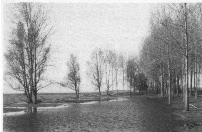
Afkalvende oever van de Hoogezandsche Gorzen. Enkele populieren staan op het punt in het water te kapseizen.

worden beide soorten kortgehouden. De buizerdnesten bevonden zich in het griendcomplex, respectievelijk de eendenkooi.