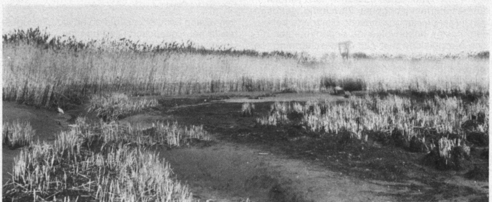
De Hoogezandsche Gorzen vóór de sluiting van het Haringvliet in 1970. Riet en biezen zijn inmiddels geheel verdwenen.

De soortmutaties nalopend zien wij enerzijds de invloed van landelijke populatietrends en anderzijds de veranderingen in de structuur van de Hoogezandsche Gorzen, waarbij het verdwijnen van de riet- en biezenvelden, beweiding en het doorschieten van de wilgen in het griendcomplex en in de eendenkooi de hoofdmoot vormen. Zomer 1991 kwamen als belangrijkste soorten uit de bus Blauwe Reiger (49 paren tegen 70 paren in 1990), Grauwe Gans (1 paar), Buizerd (2 paren), Bruine Kiekendief (2 paren), Tureluur (3 paren), Ransuil (1 paar), Groene Specht (1 paar), Gekraagde Roodstaart (11 paren), Bosrietzanger (16 paren), Grasmus (6 paren) en Wielewaal (6 paren). Van de totaal 476 broedparen die de vastgestelde 55 soorten opleverden, was de Blauwe Reiger de talrijkste met de Wilde Eend (42 paren) en de Fitis (36 paren) op de tweede respectievelijk derde plaats. De kolonie Blauwe Reigers bevindt zich in de eendenkooi; in 1970 telde deze zes nesten, in 1978 negentig. Opmerkelijk was het ontbreken van Ekster en het geringe bestand aan Zwarte Kraaien (3 paren) in deze overigens ogenschijnlijk voor beide soorten geknipte biotoop. Uit jachtbeheersoverwegingen