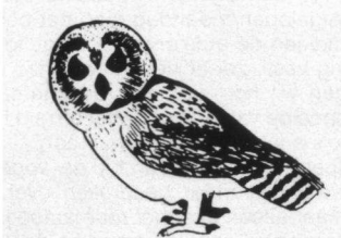
Vignet van de Vereniging.

De Vogelwerkgroep Koudekerk/Hazerswoude en Omstreken legt zich niet alleen toe op vogelactiviteiten. Landschapsonderhoud en educatie behoren eveneens tot de belangrijke werkzaamheden. Het is overigens tekenend voor deze tijd dat steeds meer vogelwerkgroepen de vleugels uit-