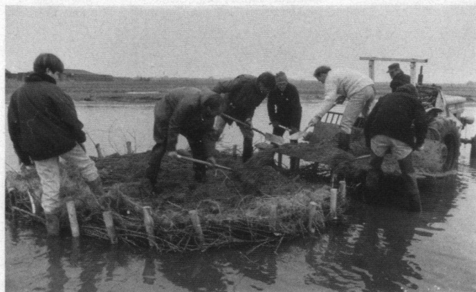
Leden van de Vogelwerkgroep Texel zijn bezig met het scheppen van kunstmatige eilandjes voor sterns en Kluten in De Petten bij De Mokbaal. De eilandjes zijn in de loop van het seizoen goed gebruikt door de Visdief, Noordse Stern en Kluut.

Texel is een gevarieerd eiland en gevarieerd zijn ook de excursie-activiteiten van de vogelwerkgroep. Rond oud/nieuwjaar wordt De Slufter bezocht, in de zomervakantie de Horsmeertjes, in het voorjaar zijn er vroege vogelwandelingen. In de 'Texelse Courant' verschijnen de excursieaankondigingen. Bij het secretariaat van de werkgroep kan eveneens over de mogelijkheden worden geïnformeerd (02220-14 239). Ook door andere organisaties worden op Texel interessante excursies verzorgd zoals door het Staatsbosbeheer (informatie bij EcoMare) en door 'Natuurmonumenten' (02220-12 590).