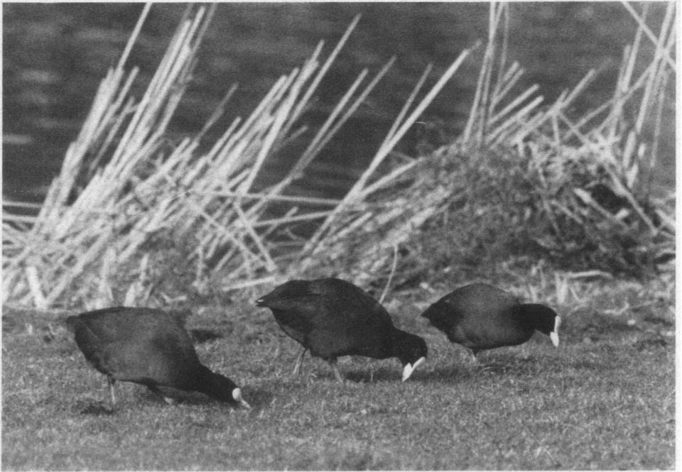
Tweede prijs. Meerkoeten, Zevenhuizen Z.-H., 27 februari 1992. Asahi Pentax MX, SMC Pentax 14/300 mm.