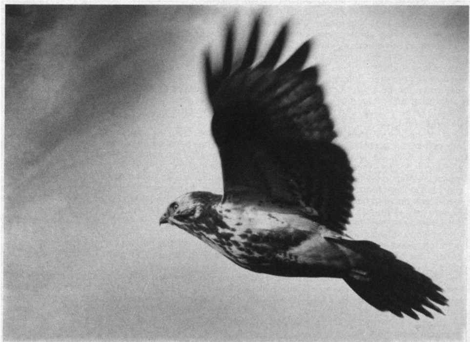
Tweede aanmoedigingsprijs. Buizerd, Zuidelijk Flevoland, 1 januari 1991. Leica Ru, Telyt 8.8, 560 mm.