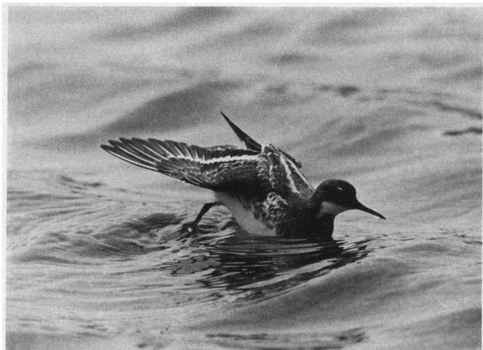
Eerste aanmoedigingsprijs. Grauwe Franjepoot in zomerkleed, Weversinlaag, Schouwen-Duiveland, 15 mei 1992. Nikon F 801S, 600 mm, inclusief teleconverter 1,4x, F/8- 125 à 250 seconden.