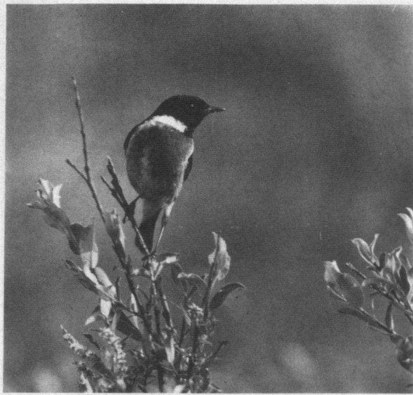
Eerste prijs Ektarfilm. Mannettes Roodborstapuit, Texel, mei 1992. Sigma 500 mm. Ektar 100 asa.

aandoenlijk, kopjes van de jongen op de rug heel pittig, maar oudervogel zonder zichtbaar oog, een poging om dan maar een pupil in de foto te krassen was niet goed gelukt; Brandgans verjaagt Rotgans van Mies Koks - rake actie, goed in beeld geplaatst, maar te veel saaie voor- en achtergrond, waarom niet een lage brede uitsnede gemaakt?; spetterende Brilduiker van Gerard de Hoog - dynamisch, toch niet scherp genoeg, ongerechtigheid linksboven in beeld; Kluut voedselzoekend - karakteristieke houding, actie, spiegelbeeld, helaas wat 'vieze' vlekken en plekjes in de achtergrond; Boerenzwaluw vleugelstrekking op draad, van A.C. Zwaga - na veel discussie er uit, volgens de meerderheid van de jury duidelijk minder dan andere Boerenzwaluwopname (met jongen); juveniele Zilvermeeuwen van Mike Weston - aardige actie en compositie, maar toch niet werkelijk bijzonder.