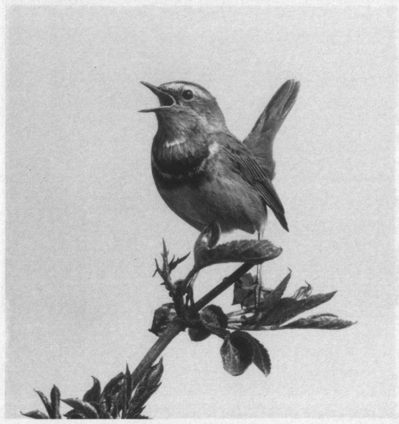
Derde prijs. Witgesterde Blauwborst, Noorderplassen, Almere, 11 april 1992. Pentax LX, Leitz Telyt 560 mm.