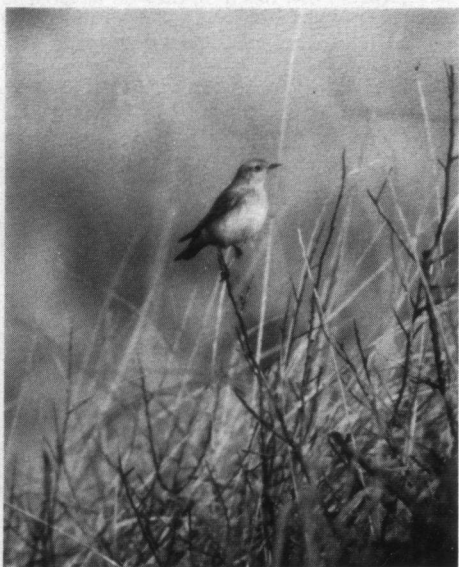
Vrouwtjes Bonte Tapuit, eerste winterkleed, Katwijk aan Zee, 1 november 1992.