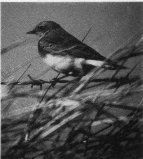
Vrouwtjes Bonte Tapuit, Noorderboulevard, Katwijk aan Zee, 1 november 1992.