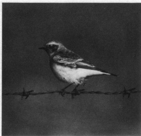
Mannetjes Bonte Tapuit, eerste winterkleed, Petten, gemeente Zijpe, 26 oktober 1992.

De bovenstaande waarnemingen betreffen de tweede en derde waarneming van de Bonte Tapuit in Nederland. De eerste waarneming werd gedaan op 28 mei 1988 op Schiermonnikoog, ook dát betrof een vrouwtje.