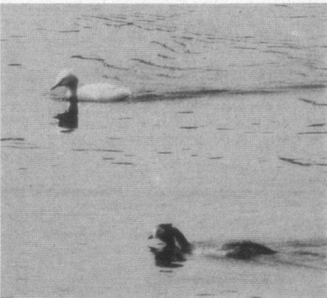
Albino Fuut, Verbindingskanaal tussen Maas en Grote Siep, Mook-Middelaar, 28 mei 1993.

Witgatje. 9-4-93 1 ex. Aalkeet Buitenpolder, Vlaar-