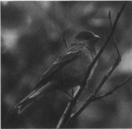
Roodmus ♂, duinen Hoek van Holland, 28 juni 1993.

Putter. 27-6-93 4 ex. camping Haanjes, Formerum, Terschelling, 13-7-93 2 ex. Natuurpark, Lelystad (D. Keurhorst).