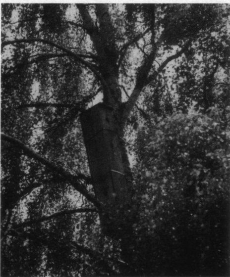
Etalagekast voor Gierzwaluwen, Abernethy Forest bij Nethy Bridge, 1992. Naar een dia van Paul van der Poel.

Het is niet de eerste keer dat Gierzwaluwen in het Gooi in bossen broedden. In één van de bosrijkste wijken van Hilversum-West nestelde in 1982 een paar Gierzwaluwen in een spreuwenkast (Taapken 1983).