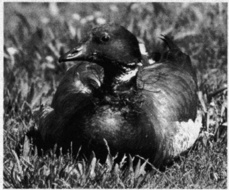
Rotgans met een stuk van net om de hals. Schiermonnikoog, 20 juni 1993.

Of deze Rotgans kan vliegen, wordt niet duidelijk, maar er is niets dat op het tegendeel wijst. Geen hangende vleugel(s) en de conditie van de vogel lijkt, ondanks het net, zonder meer niet slecht. Toch heeft deze Rotgans 'besloten' niet met de soortgenoten naar de broedgebieden in het noorden van Scandinavië, Finland en Rusland te vertrekken, maar te proberen hier de zomer door te komen. Zou zo'n vogel alsnog naar het noorden vertrekken als men hem zou vangen, van zijn kwelling ontdoen en weer loslaten? Waarschijnlijk toch niet. De door hormonen aan-