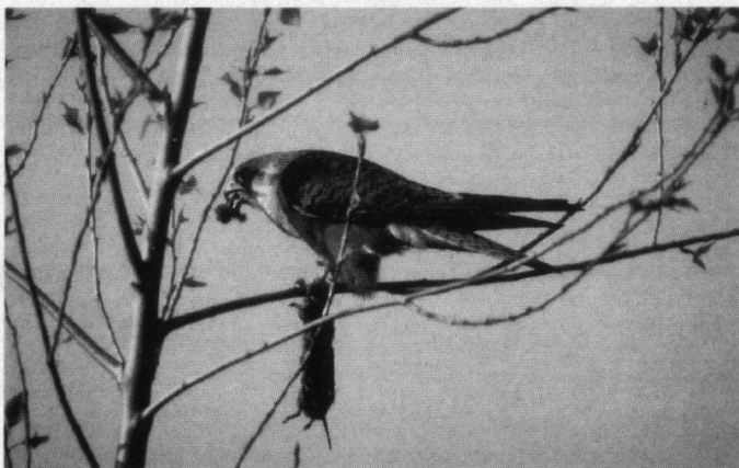
Roodpootvalk, wijffe, Paradijsvogelweg, Flevoland, 30 april 1995.

Burg, E. van der, R.M. van Dongen, G. Driessens & P.W.W. de Rouw (1988): Recente meldingen: april, mei en juni 1988. Dutch Birding 10: 150-160. Dongen, R.M. van, H. Gebuis & P.W.W. de Rouw (1992): Recente meldingen: mei en juni 1992. Dutch Birding 14: 152-157. Eykman, C., P.A. Hens & F.C. van Heurn (1936-1949): De Nederlandsche Vogels. I-III. Wageningen. Hogg, R.H. (1977): Food piracy by Red-footed Falcons. British Birds 70: 220. Glutz von Blotzheim, U.N., K.M. Bauer & E. Bezzel (1971): Handbuch der Vögel Mitteleuropas. Frankfurt am Main. Kist, J., M.J. Tekke & K.H. Voous (1970): Avifauna van Nederland. Leiden. Sovon (1987): Atlas van de Nederlandse Vogels. Arnhem.