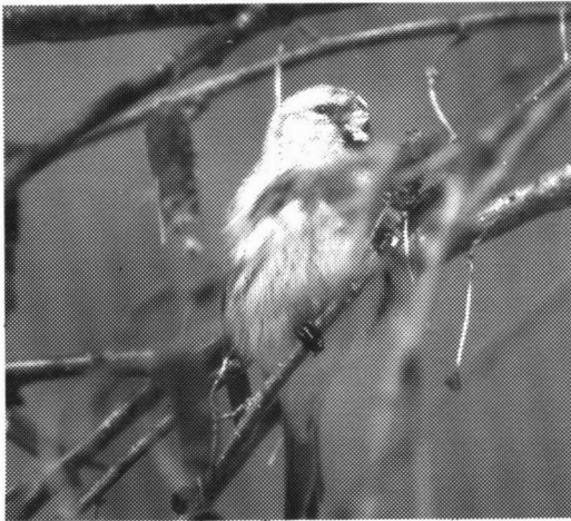
Witsluitbarmsijzen. Groningen, 6 februari 1996.