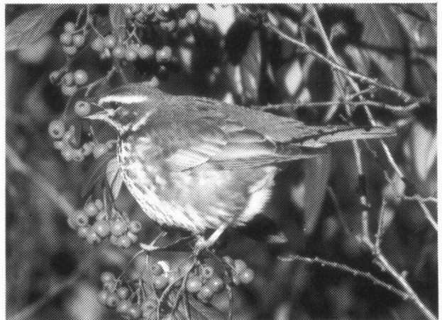
Koperwiek. Er was deze winter 1995-96 sprake van een ware invasie.

De bekende Notenkraker van Delfzijl werd nog tot 3-3 gezien.