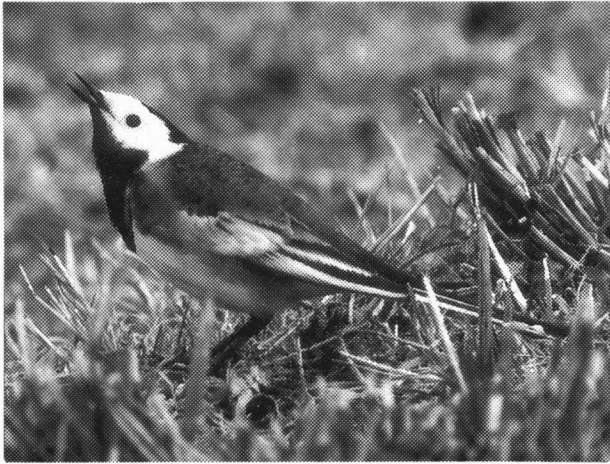
Rouwkwikstaart. Veenhuizerstukken, maart 1996.