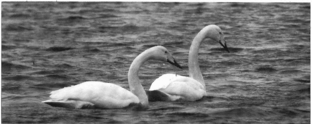
Wilde Zwanen. Veenhuizerstukken, maart 1996.