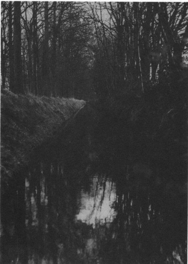
Stelloevers, onneembare barrières voor veel dieren

Dieren hebben verbindingswegen nodig om zich te kunnen verplaatsen: om voedsel te zoeken, een partner, een plek om te broeden, beschutting tegen slecht weer of tegen een overvliegende roofvogel. Ook planten verplaatsen zich, vooral in de vorm van zaden, sporen en stuifmeelkorrels.