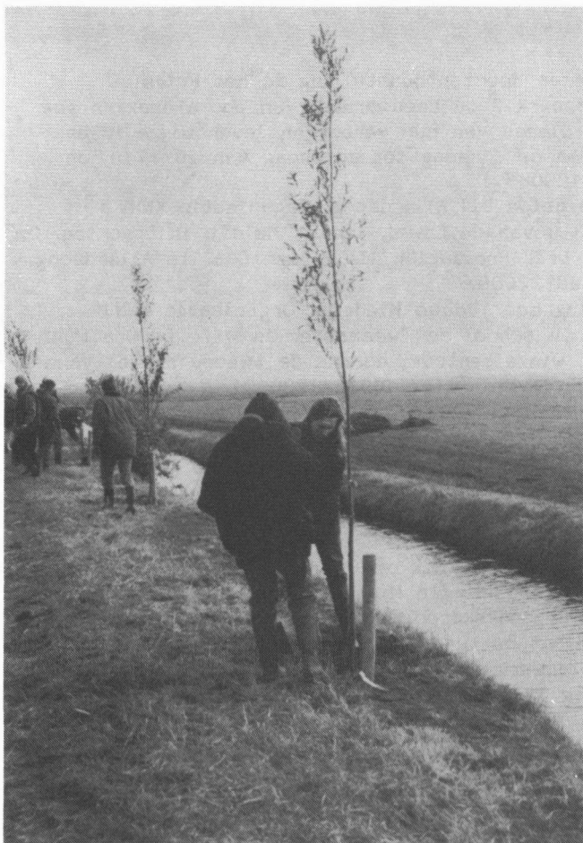
SILF-vrijwilligers planten wilgen bij het Ottema-Wiersma reservaat