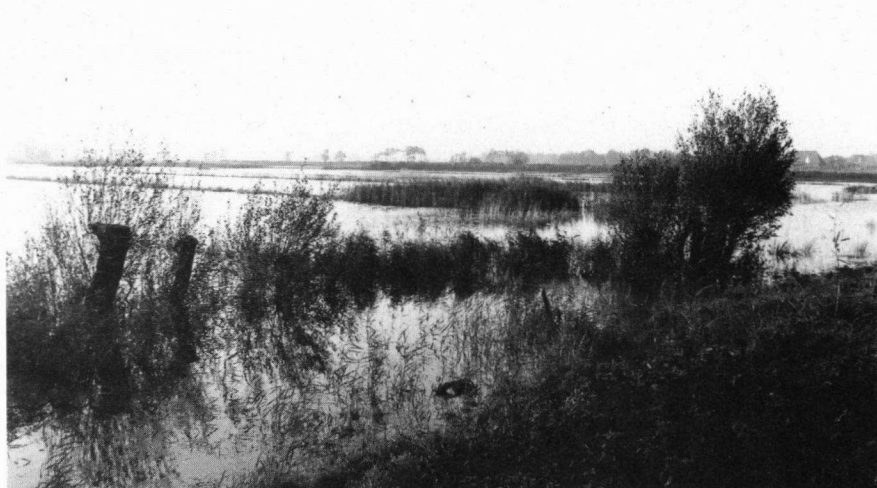
Moeras en boezemland

Het initiatief was ingegeven door de decentralisatie van het natuurbeleid in de richting van de Provincies waarbij de rol van LNV verschuift naar 'sturen op hoofdlijnen en toetsen op resultaat'. Meer nog dan voorheen komt hierbij een zwaar accent te liggen op een deugdelijke verantwoording op basis van betrouwbare gegevens over bereikte resultaten en effecten. Een kwalitatief goede evaluatie van natuurbeleid en een tijdige signalering van problemen is hiervan afhankelijk. Ook de resultaten van het 'Programma Beheer' zullen leiden tot een behoefte aan betere gegevens over de uitvoering en effecten van natuurbeleid en -beheer.