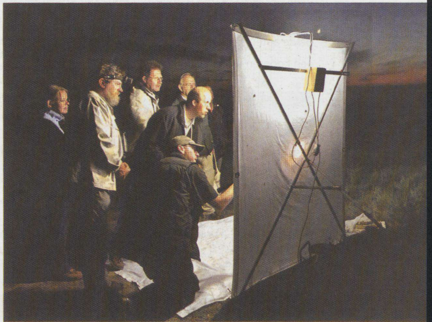
Vlinderliefhebbers bekijken de nachtvlinders die op het laken zitten.

De organisatoren van de Vlinderstichting hopen een groter publiek te interesseren voor nachtvlinders, maar ook het simultaan verzamelen van gegevens over de verspreiding van deze dieren is van groot belang, benadrukt Groen-