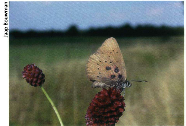
Voor de herkenning zijn die extra stipjes wel wat lastig!

The Dusky Large Blue ( Maculinea nausithous ) is a rare species throughout Europe. A population in the Roerdal, close to the German border, disappeared around 1970, but the species was sighted there again in 2001. Since then, the species has been monitored in the area and its numbers are increasing, with a total of eighty butterflies counted and marked in 2005. A conservation programme has been drawn up and Dutch Butterfly Conservation is working with local authorities to improve the species' habitat. By purchasing more land, and managing it appropriately, and by providing information on these measures to involve the public and create awareness among landowners and visitors, the Dusky Large Blue should have a better future in the Netherlands.