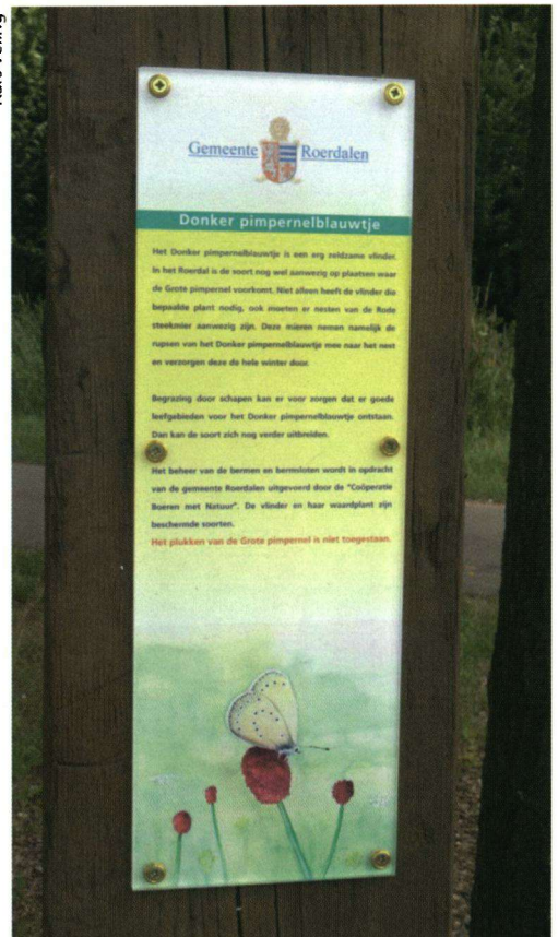
Door borden worden de bezoekers en inwoners van het Roerdal geïnformeerd over de vlinder en zijn leefgebied.