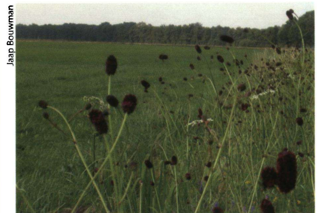
Samen met de gewone steekmier is de aanwezigheid van grote pimpernel essentieel voor het donker pimpernelblauwtje.

Omdat de waardmieren nesten onder deze weinig verstoorde omstandigheden vrij groot kunnen zijn en een aantal rupsen per jaar groot kunnen brengen, kunnen de donker pimpernelblauwtjes ook op zeer kleine en vaak marginale plekken voorkomen. Toch lijkt het er op dat de rupsen zoveel broed eten dat de mier plaatselijk verdwijnt en dus ook de vlinder op die plek niet meer kan overleven. Dat zien we ook in het Roerdal, waar maar