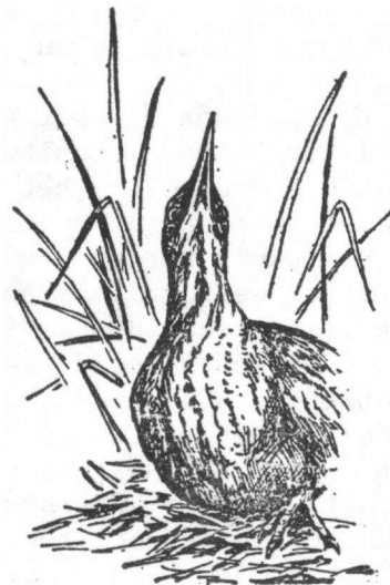
FIG. 15 B.— "Freezing" posture of bittern, showing the eyes turned forwards to give binocular vision beneath the head, and towards the threatened danger.

Mijn conclusie luidt dan: de schuine paalstand gecombineerd met het fixeren van een plek op de grond kan men interpreteren als middel om trefzeker toe te stoten en prooi te vangen.