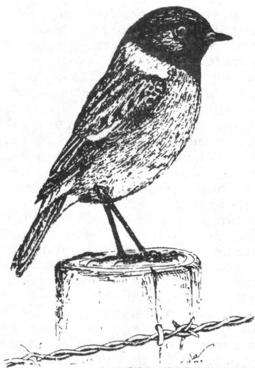
* ROODBORSTTAPUIT ( Saxicola torquata )

Dit geldt ook voor de Veldleeuwerik en ook de Roodborsttapuit doet het op dit ogenblik heel goed. Het