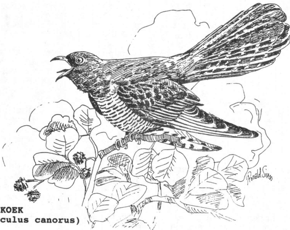
* KOEKOEK ( Cuculus canorus )

dus als ik straks wat domme dingen over vogels zeg dan moet u mij dat maar niet kwalijk nemen.