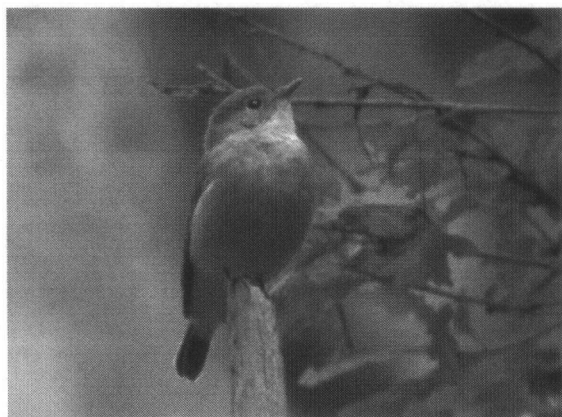
Kleine vliegenvanger