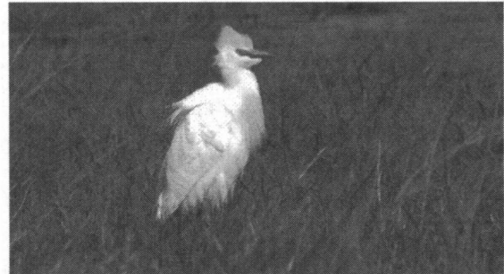
Koereiger De opmerking over fotografen slaat niet op haar.

13 mei is de jaarlijkse Big Day in het Gooi en dit levert mij een totaal onverwachte lachstern op bij Vreeland. Uiteindelijk zullen wij deze dag 133 soorten zien, maar voor mij verder geen nieuwe jaarsoorten, dat is toch al een teken aan de wand, dat ik goed op stoom ben dit jaar. Op 18 mei vliegt een zwarte ooievaar over de Keverdijk en verschijnen de eerste kleinst waterhoentjes in de regio. Ook zij zullen dit jaar een goed broedseizoen kennen; later in het jaar worden er op meerdere plekken jonge vogels waargenomen, die af en toe heel mooi te zien zijn.