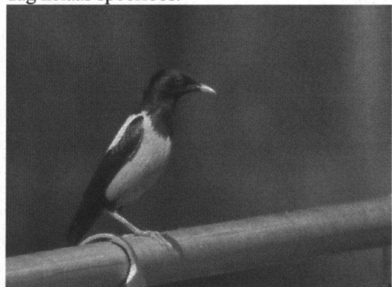
Roze spreeuw

Eind mei brengt nog een paar onverwachte toppers mee. Op 27 mei wordt door Olaf Langendorff een adulte roze spreeuw ontdekt bij de golfvelden van Crailo. De vogel laat zich fantastisch mooi zien, maar blijkt de volgende dag helaas spoorloos.