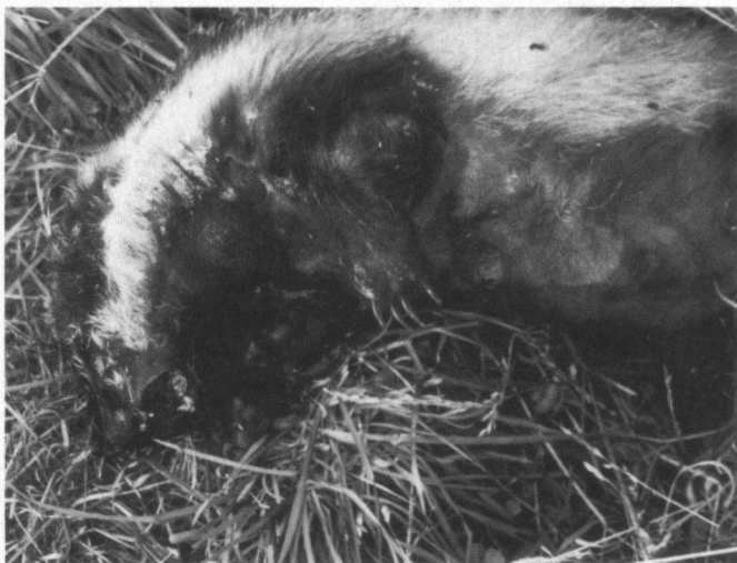
Drempels verlagen de verkeerssnelheid en voorkomen slachtoffers als deze. Minister Dehaene wil er echter niet van weten.