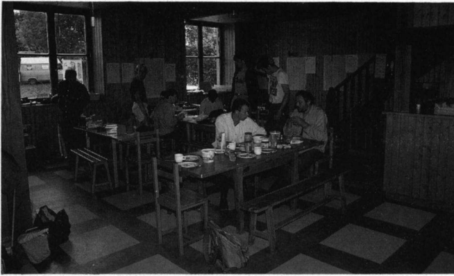
Zomerkamp van de VZZ Veldwerkgroep in de Limousin.