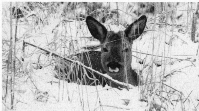
Reeën in dekking zijn moeilijk te zien, zeker voor trimmers.