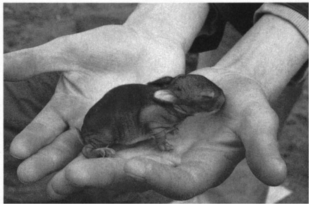
Pas geboren konijnen werden als een bijzonder gerecht beschouwd.

meerd hebben. Vermeldingen van cuniculi zijn zeldzaam in Romeinse teksten. De enige notitie aangaande konijneconsumptie vindt men bij Plinius de Oudere (23-79 na Chr.). Hij schrijft in zijn 'Historia Naturalis' dat bij de Iberiërs, in het huidige Spanje, de foetussen of pasgeborene konijnejongen als een bijzonder gerecht werden beschouwd en dat de (rijke) Romeinen deze mode overnamen. De voorliefde van het decadente Rome voor culinaire extravagancies is wijd en zijd bekend. De ongetwijfeld smakelijke brokjes vlees werden als laurices aangeduid. Of de Romeinen graag volwassen konijnen aten weten we echter niet. Dieren die onder de aarde leefden werden in die tijd wel eens gerangschikt bij de schepsels der onderwereld en misschien was het konijn wel des duivels, net zoals de rat en de slang.