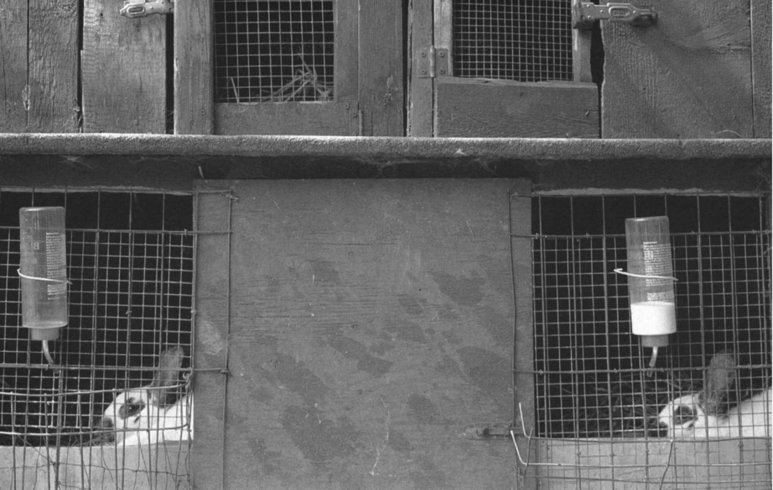
Het nobel konijn verworpen tot een kotkonijn.