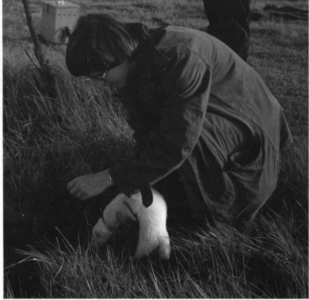
Met de vret op konijnenjacht.

Vanaf het eind van de 13e eeuw komen de konijnewarandes volop in de mode. In Nederland, meer specifiek