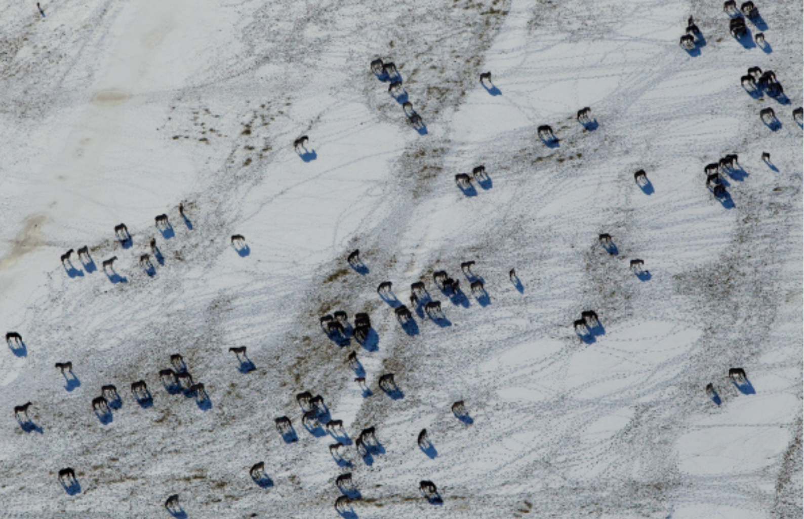
Boven: luchtopname van een kudde koniks Rechts: edelherten in de sneeuw