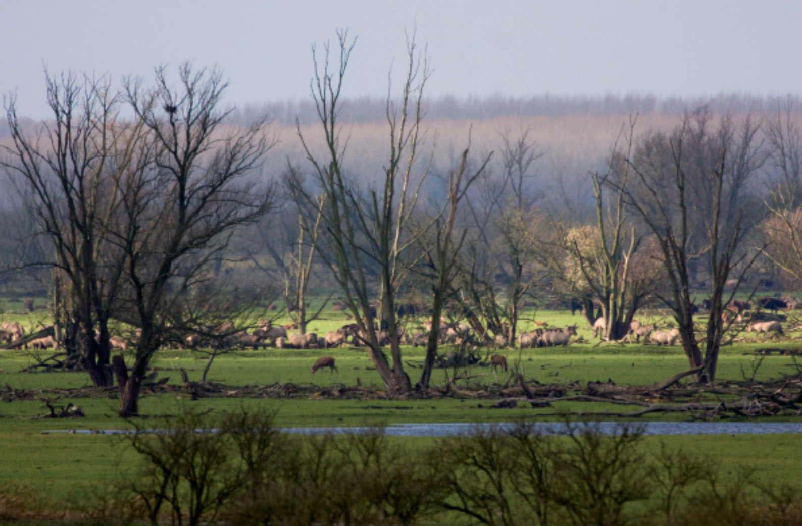
Konikpaarden, edelherten en Heckrunderen in de Oostvaardersplassen.