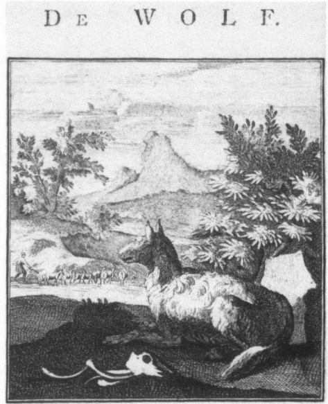
Figuur 4. Wolf op de loer bij een schaapskudde. Illustratie uit Zamenspraaken (1769).

Het beeld is duidelijk; ook mensen zijn voor de Wolf niet veilig. Net als in de verhalen en prenten over de Wolf als veerover, zit ook