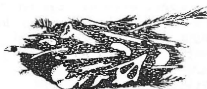
Braakballen van de Bosuil. Boven een bos- en onder een stadsparkbewoner.